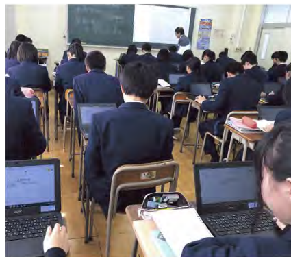
Google for Education を活用した授業により日常的に情報活用能力が養われている

「群馬県として 12 年間を通じた教育のデジタル化を推進していくためのソリューションを検討しました。Google for Education では、Google ドキュメントや Google スプレッドシートで同時編集ができ、Google Meet で双方向の学習も可能です。また、これらを活用することで協働的な学習が可能になり