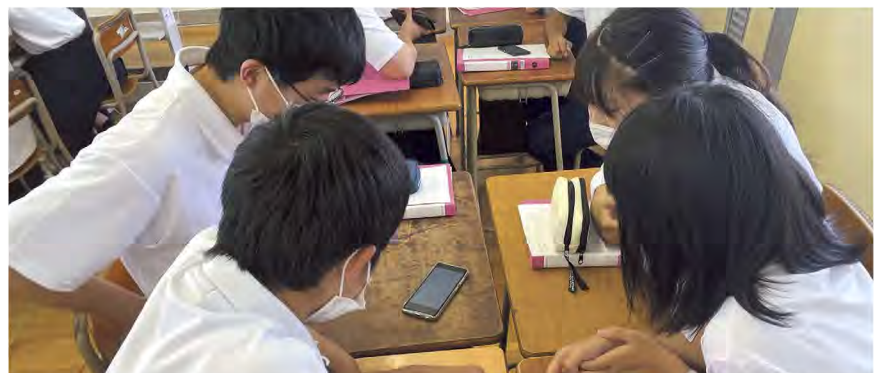
今年度から情報を 1 年次カリキュラムに設定し、ICT 教育を加速させている。グループワークでは端末を積極活用