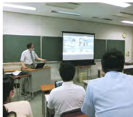
教員向け研修を充実させている秋田県。初歩から丁寧にフォローしている